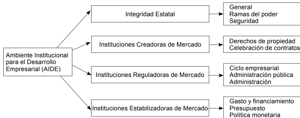
Gráfico 1. Estructura del marco conceptual 8