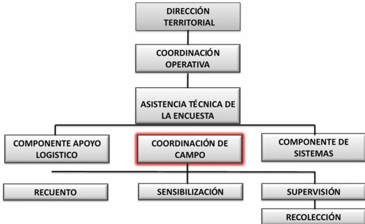
Figura. 1. Esquema operativo.

La organización del trabajo de campo mediante la administración siempre está enfocada a lograr fines o resultados buscando optimizar los resultados a través de la colaboración de otras personas con el fin de obtener eficiencia y eficacia mediante la planeación, organización, dirección y control estableciendo la necesidad de la capacidad administrativa de quienes participan activamente, la Gran Encuesta Integrada de Hogares contempla un esquema de trabajo que comprende: involucra dentro de su organización varios niveles jerárquicos, los cuales se enuncian a continuación: