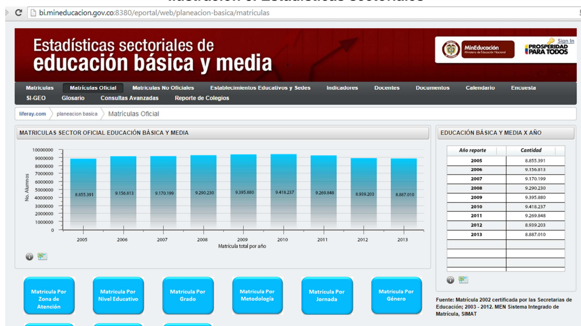
Ilustración 5. Estadísticas sectoriales

Otro de los canales mediante los cuales se puede solicitar información de matrícula, estadísticas e indicadores educativos, es a través del Sistema de Atención al Ciudadano. Este sistema, es un servicio implementado por el Ministerio de Educación Nacional para recibir comunicación de parte de los ciudadanos, en cumplimiento del Decreto 1151 de Gobierno En Línea. Este sistema permite realizar peticiones, quejas, reclamos y solicitudes que incluyen información del sector educativo, entre ellos estadísticas y datos: