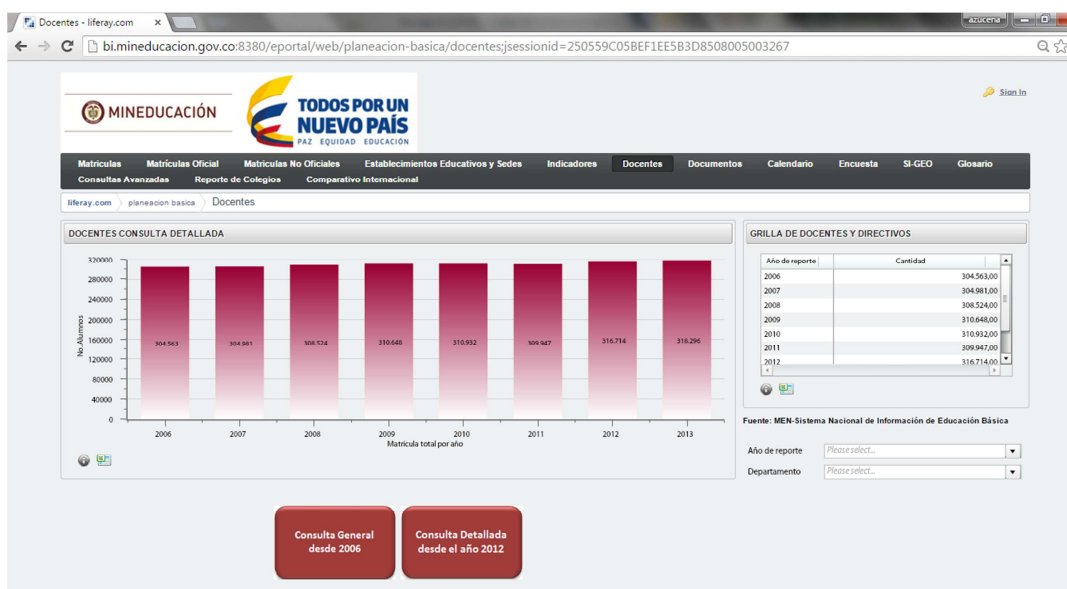
Ilustración 1. Estadísticas sectoriales

http://bi.mineducacion.gov.co:8380/eportal/web/planeacion-basica/docentes