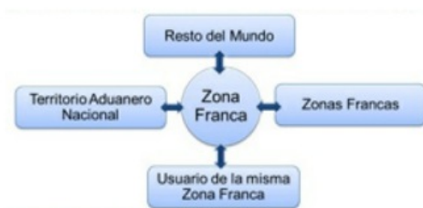
Gráfico 3. Movimiento de mercancías en zonas francas

Las estadísticas del movimiento y comercio exterior de mercancías en ZF abarca todo el movimiento legal de ingresos y salidas de mercancías con el resto del mundo, el territorio aduanero nacional, otras ZF y usuarios de la misma ZF.