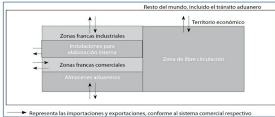
Gráfico 1. Elementos territoriales y posibles importaciones y exportaciones según el sistema comercial general