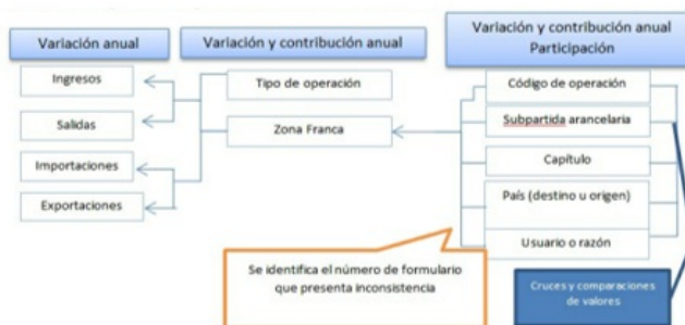
Gráfico 2. Esquema del proceso de validación de la información de zonas francas

En términos generales, el proceso de validación se realiza de acuerdo con el siguiente esquema: