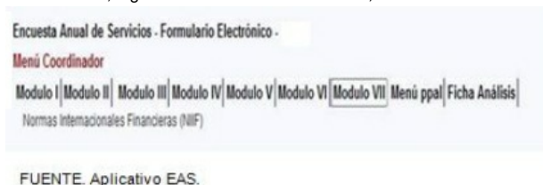
Figura. 10. Estructura de módulos aplicativo EAS.

Verificar la información reportada en este módulo, ingresando en el menú Módulo VII, como se muestra a continuación: