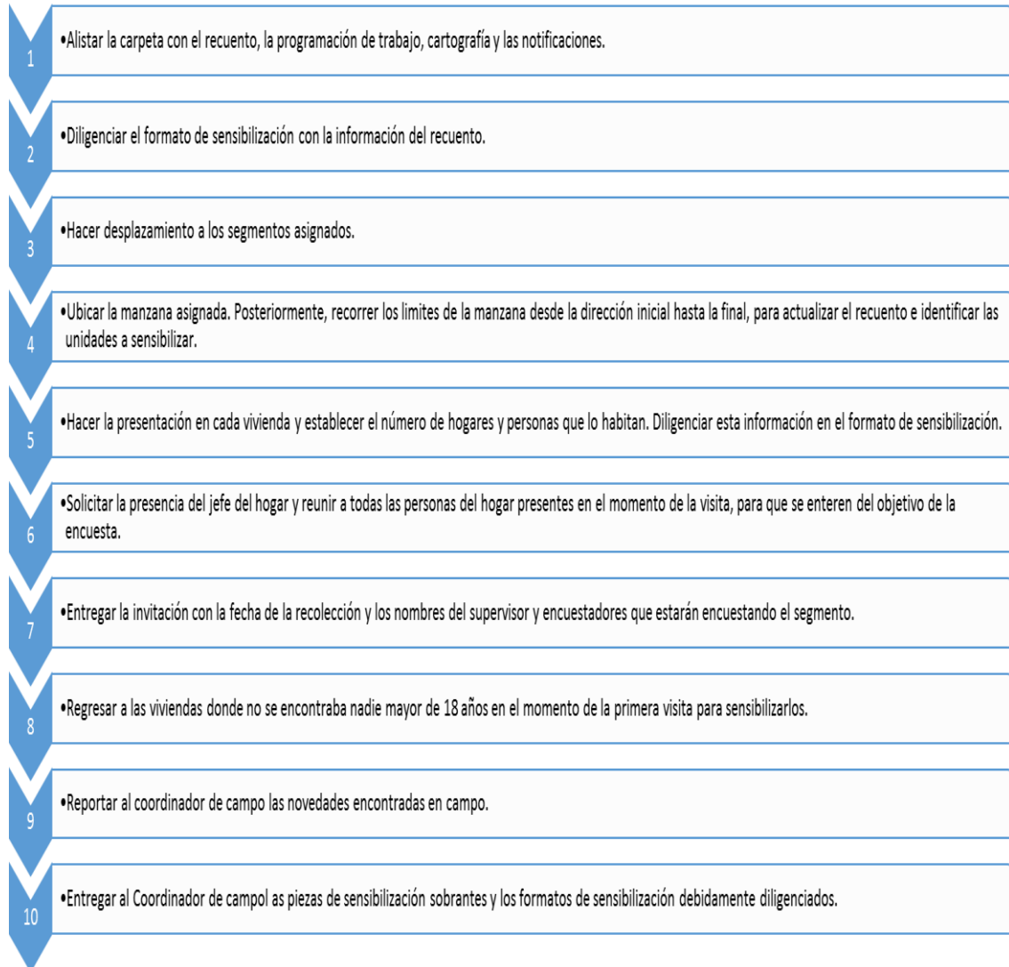
Ilustración 2. Cómo debe realizarse la sensibilización.