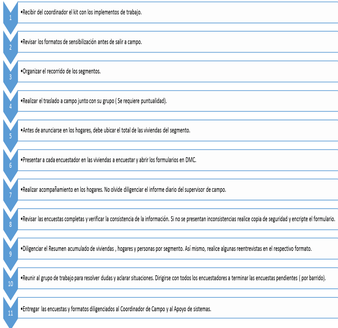
Ilustración 4. Cómo debe realizarse la supervisión.

NOTA: Cuando el supervisor rural (con contrato superior a 30 días continuos) termine de trabajar en la ruta rural asignada, se desplazará a la parte urbana donde los días restantes del mes, apoyará en los procesos de recolección, recuento, sensibilización, revisión de información, revisión de cobertura, acompañamiento de encuestas pendientes y reentrevistas.