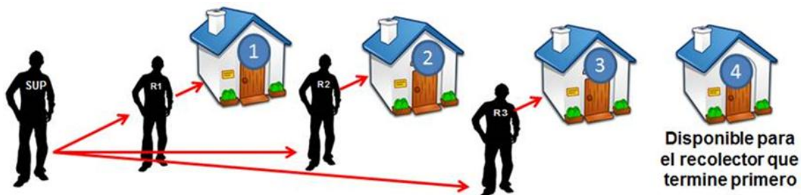
Figura 1. Sistema de barrido.

Una vez que haya finalizado la recolección del segmento, el supervisor se desplazará hacia el siguiente segmento asignado, donde continuará con la misma labor.