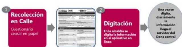
Figura 5. Operativo de Campo 659 Municipios Clase 3

En la siguiente imagen se observa cómo se realizará la recolección de la información en los 659 municipios que hacen parte de la operación censal. La información será recolectada en papel y digitada en línea por el personal de las alcaldías, con el continuo acompañamiento y monitoreo del personal del DANE.