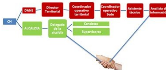
Figura 7. Estructura organizacional del operativo 659 municipios clase 3