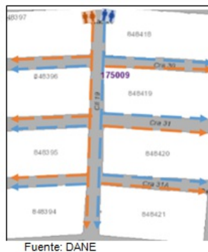
Figura 2. Distribución del personal de recolección

3. Si el recorrido se hace por las carreras, para las calles que cruzan dichas carreras (vías perpendiculares) se puede hacer un barrido visual siempre y cuando no haya obstáculos que impidan la visualización completa. Lo mismo aplica si el recorrido se hace por las calles y son las carreras las vías perpendiculares que cruzan las calles.