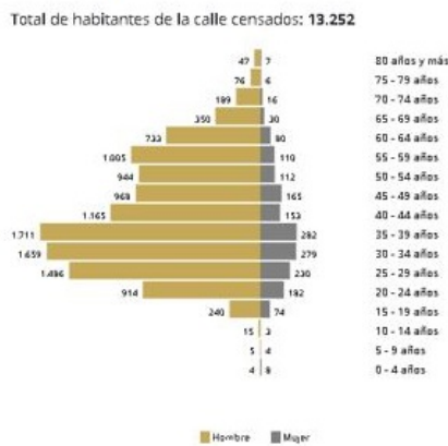
Figura 1. Pirámide de Población CHC 2019

18. 2019- San Andrés Islas: Atendiendo los requerimientos de la gobernación de San Andrés, y en marco de la ley 1641 de 2013, el DANE realizó el censo de habitantes de la calle. Para este ejercicio se coordinó la recolección con la Secretaria de Bienestar Social de la isla, quien se encargó de realizar una brigada de atención para los habitantes de la calle, allí fueron censados 10 habitantes de la calle. Los resultados no se publicaron de forma desagregada con el fin de garantizar la reserva estadística.