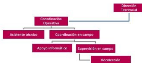
Figura 6. Estructura organizacional del operativo Villavicencio y Florencia

Para el desarrollo del operativo censal, dentro del diseño se definió la siguiente estructura operativa a nivel territorial.