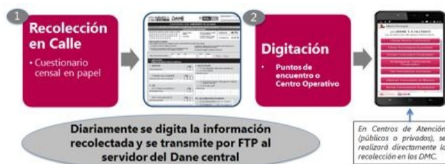
Figura 4. Operativo de campo Villavicencio y Florencia

En la siguiente imagen se observa cómo se realizará la recolección de la información en Villavicencio y Florencia, por el personal contratado por el DANE y con el acompañamiento de los promotores y el personal de la alcaldía quienes manejan la población de habitantes de la calle en estos municipios, el acompañamiento facilitará el proceso de abordaje a la población.