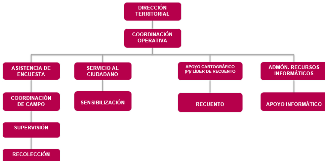
Figura 1. Esquema operativo

Dada la magnitud de la encuesta, se requiere de una organización integral que permita desarrollar de manera eficiente el operativo en campo. Con base en esto se conformaron equipos de trabajo de carácter temporal que funcionarán en varios niveles, los cuales se enuncian a continuación: