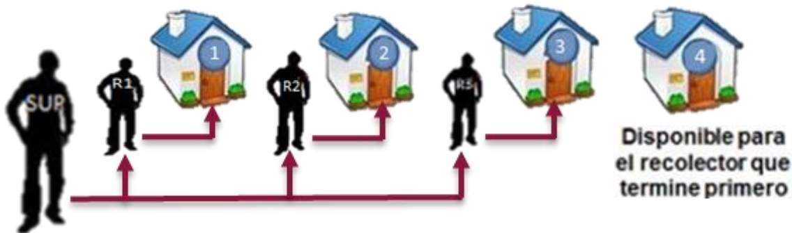
Figura 3. Descripción gráfica del sistema de barrido.