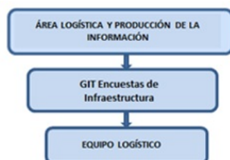
Diagrama 1. Organigrama Operativo

Adicionalmente, reciben los requerimientos de asesoría y comunican a las fuentes las observaciones e inquietudes que puedan surgir a lo largo del proceso de revisión.