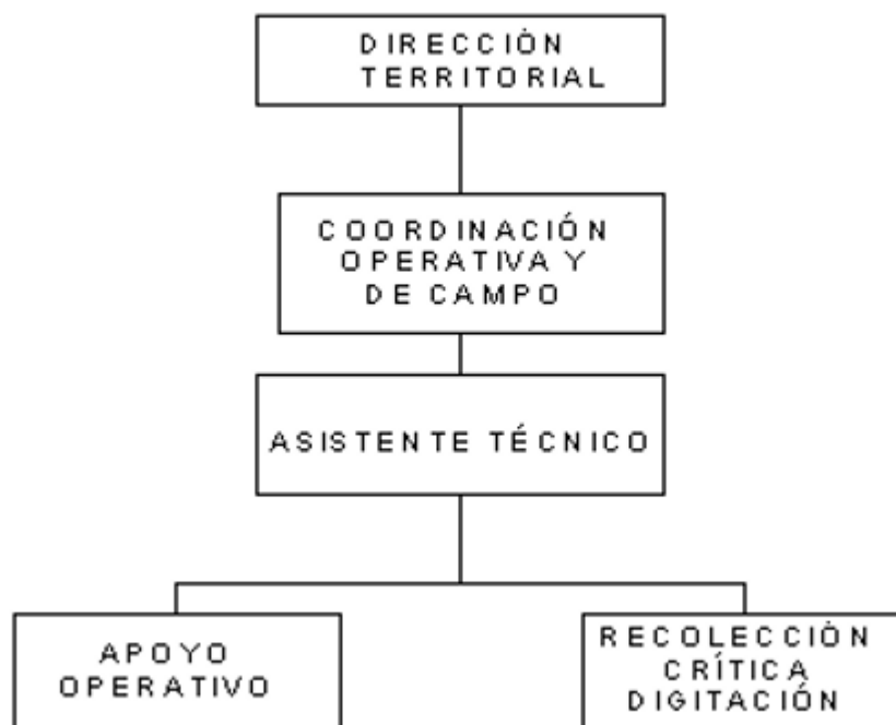
Figura 1. Esquema de trabajo de la EDIT